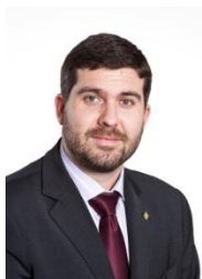
Presidente: D. Eusebio Climent Mayor.